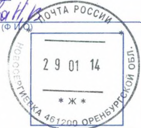
(оттиск КИШ ОПС места оформления уведомления)